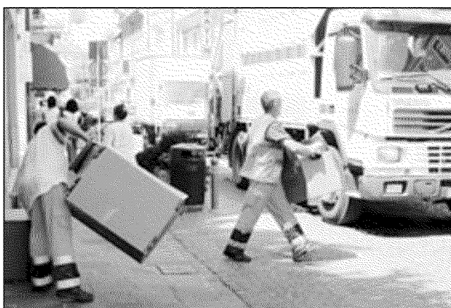
La raccolta dei rifiuti con il metodo del porta a porta