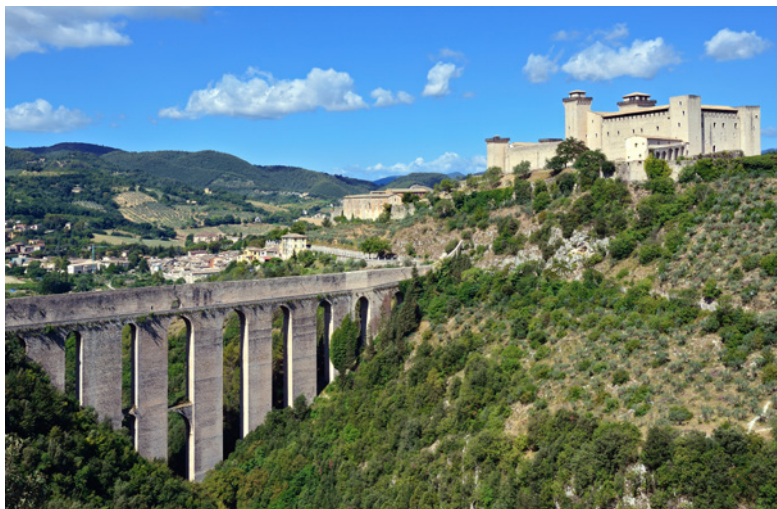
vista panoramica della Rocca