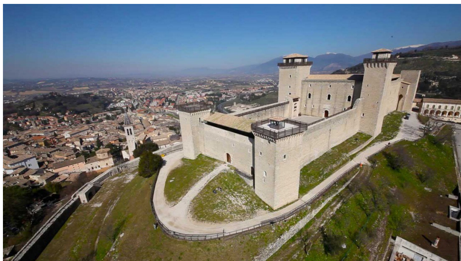
vista dall'alto della Rocca

Ore 11.30 - Rocca Albornoziana di Spoleto, Cortile d'Onore