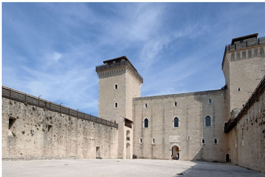
vista del Cortile delle Armi