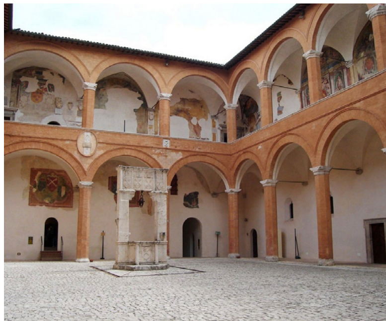
vista del Cortile d'Onore