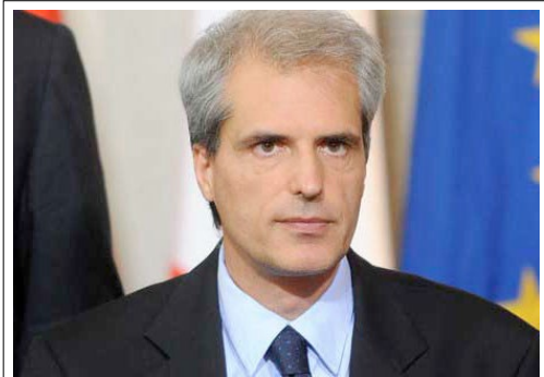
Sergio Balbinot, presidente Insurance Europe