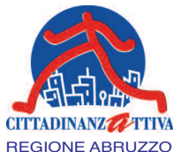
Tavola Rotonda e Presentazione del Volume